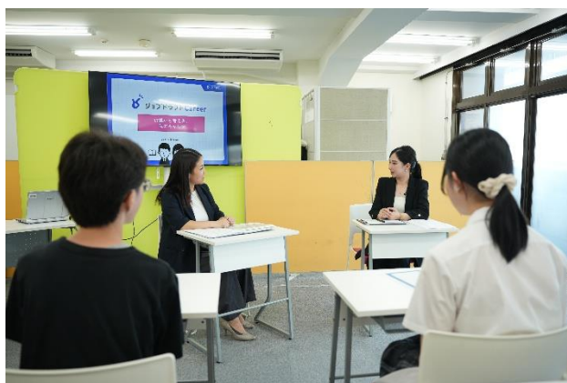
▲「キャリア」について語っている様子