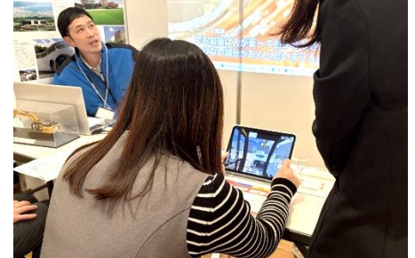
▲ゲームで重機の操作体験（建設・静岡会場）