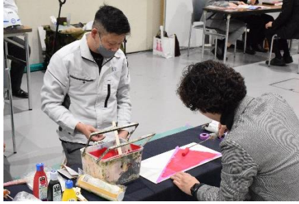
▲塗装体験（建設・広島会場）