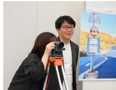
▲測量体験 (建設・長崎会場)