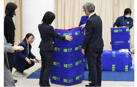
▲荷物の梱包体験（物流・島根会場）