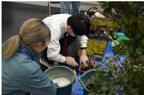
▲植木体験 (造園・京都会場)