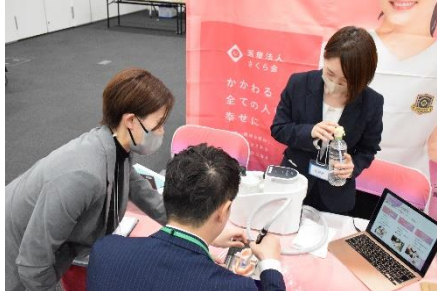
▲口腔内の水を吸う体験（医療・名古屋会場）