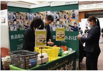
▲レジ打ち・包装体験（小売卸売・神奈川会場）