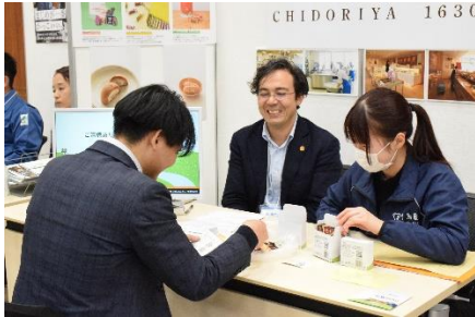
▲お菓子の箱詰め体験（食品製造・福岡会場）