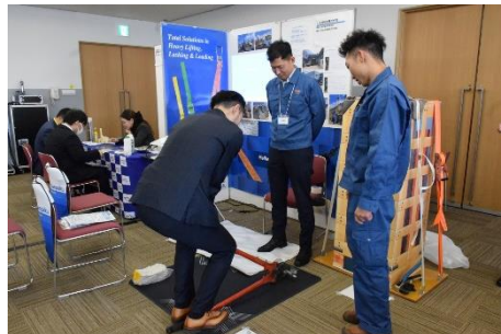
▲貨物用のワイヤーカット体験 (物流・大阪会場)