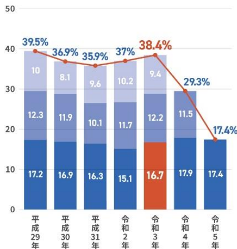
学年別3年以内離職率 / 高卒