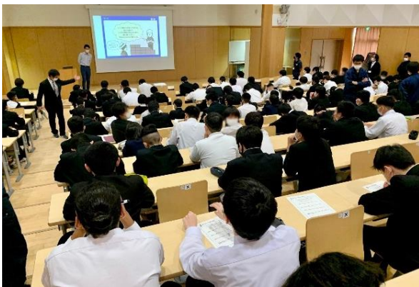
▲ 「働くとは？」働く目的について考える授業の様子