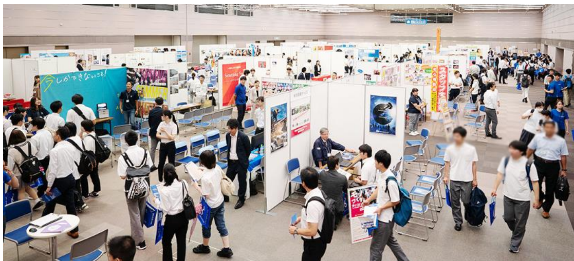
<ジョブドラフト Fes2019の様子>

https://jinjob.co.jp/business/services/jobdraftfes