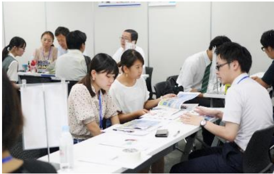
東京・大阪各 100 社規模のブースを設けます。