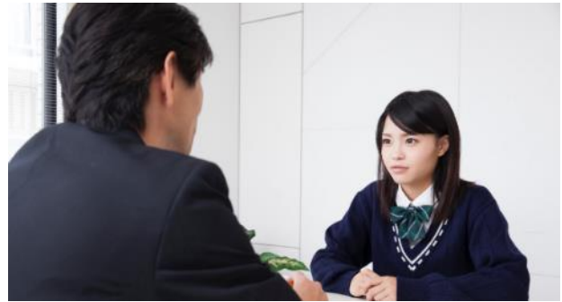
高校生の就職活動における悩み相談や企業紹介を行います。