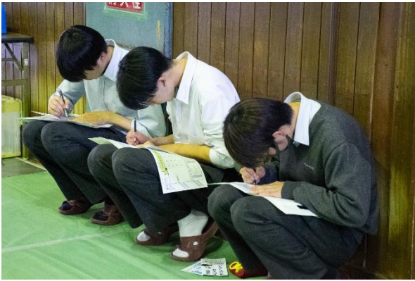
▲話を聞き終わった後、メモを取る様子