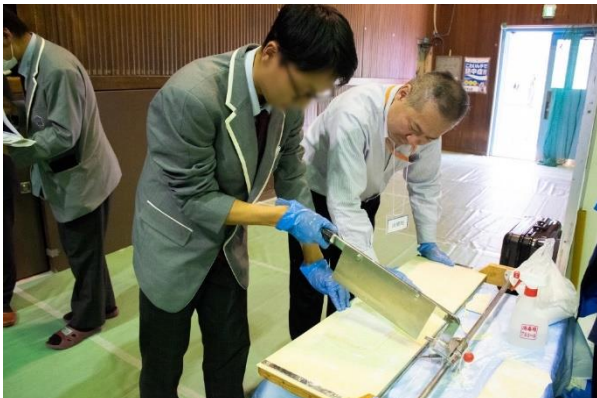
▲うどんの麺切り体験

イベント当日は、参加した生徒が各企業スペースで業界や会社について説明を受け、企業の事業にちなんだ様々な職業体験を行いました。食品製造会社ではうどんの麺切り体験や、警備業界では金属探知機を使用した手荷物検査体験、建設業界では釘打ちやハーネスの装着体験を行い、実際の仕事の一部を体験しました。生徒から積極的に質問する様子や、話を聞き終わった後に一生懸命メモを取り、楽しみながら様々な仕事に触れる様子が見られ、自己理解や企業理解を深めていただくきっかけとなりました。