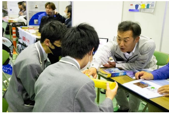
▲製品に触れながら説明を受ける様子